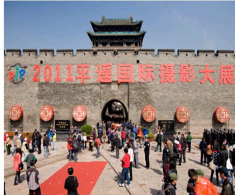
China Pingyao Intl. Photography Festival 中國平遙國際攝影大展 2011

在潘秀娟女士贊助計劃的支持下，學院就「中國平遙國際攝影大展」組成遊學及參展團，讓十一名學生及畢業生在黎健強博士的帶領下前往當地參與這項盛事並展出他們的作品，與不同地區的學生、藝術家分享交流。學院亦是香港首間及唯一藝術院校參與該國內備受矚目的國際性攝影展覽。