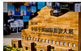
平遙國際攝影大展的概述圖（1張）