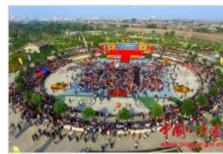
2016平遙國際攝影大展 (2張)

中國平遙國際攝影大展由山西省委宣傳部、山西省文化廳、山西省人民政府新聞辦公室、晉中市人民政府、平遙縣人民政府共同主辦。每年舉行一次，從2001年至2019年已經舉行19屆 [1] 。中國平遙國際攝影大展是一個具有中國傳統文化特色的國際攝影展，按照國際慣例運行。每屆大展都會有數百名中國和世界各地的優秀攝影師和攝影機構參展，來自世界各國各地十多萬專業攝影家和業餘攝影愛好者前來觀看展覽和參加各項活動。馬克·呂布（法國）、何奈·布里（法國）、塞巴斯蒂奧·薩爾加多（巴西）、蘇珊·梅塞勒斯（美國）、馬丁·帕爾（美國）、馬丁·弗蘭克（美國）、尤金·理查茲（美國）、盧卡斯·朱麗安（意大利）等諸多國際攝影大師都在平遙展出作品，馬格南圖片社、美國聯繫圖片社、美國國家地理雜誌社、美國光圈基金會、法國《巴黎競賽》、《PHOTO》雜誌社、德國國家地理雜誌社攝影機構也都在平遙舉辦過各種展覽及活動。 [1]